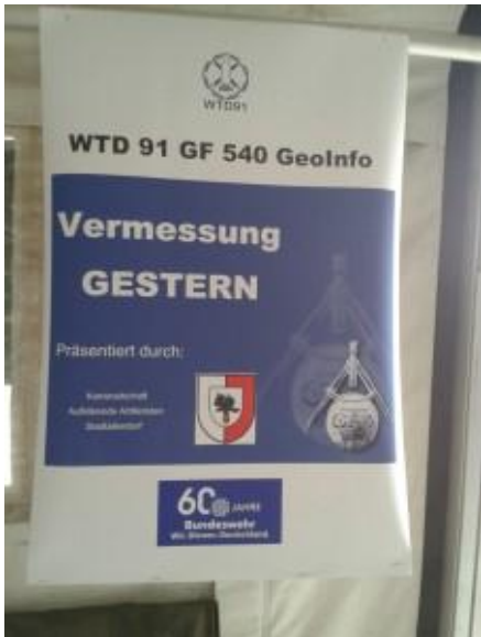
...so wurden wir vorgestellt!