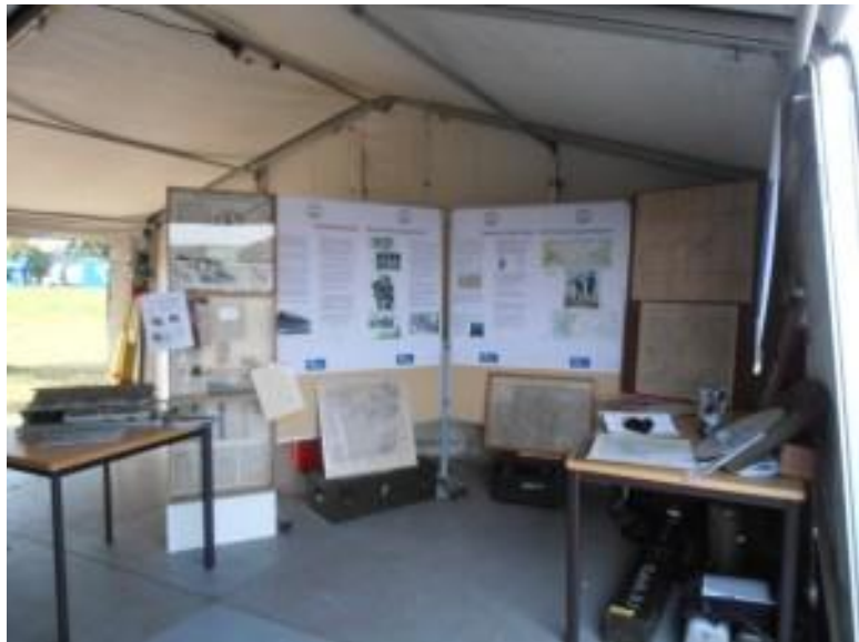
...und das ist unser "Stand"!